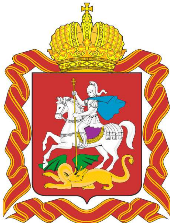
Герб Московской области